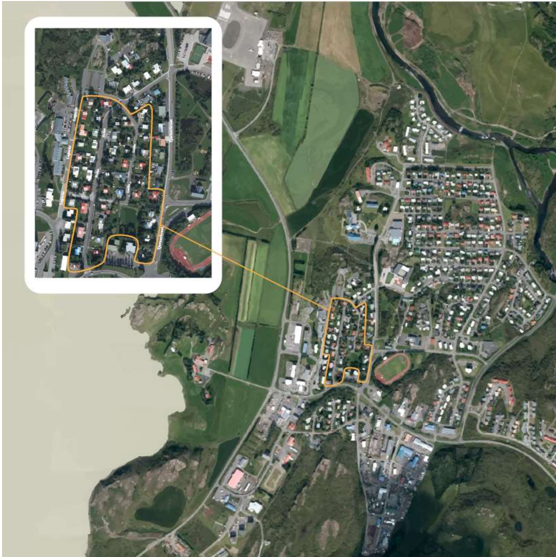
Mynd 2. Loftmynd sem sýnir staðsetningu elsta íbúðarhúsa hverfisins innan þéttbýlis á Egilsstöðum. Gul lína sýnir útmörk fyrirhugaðs verndarsvæðis.