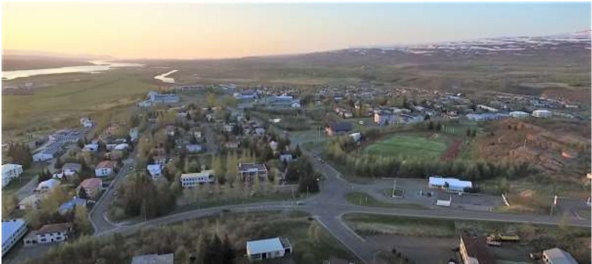
Mynd 3. Egilsstaðir sumarið 2016. Gamla hverfið á ásnum liggur vinstra megin miðju á myndinni utan Fagradalsbrautar sem hér þverar bæinn næst á myndinni. Mörg húsanna í gamla hverfinu hverfa á bak við trén. Ljós. Ívar Ingimarsson, 2016.