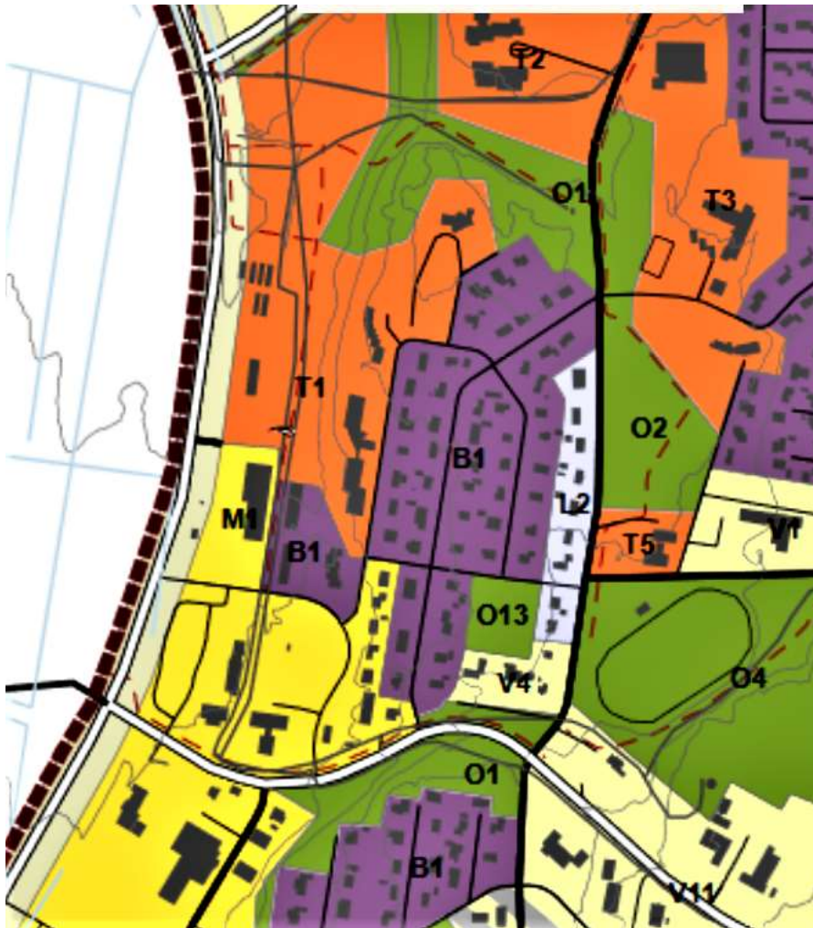
Mynd 4. Gamla hverfið á ásnum innan aðalskipulags, sjá nánar næstu mynd.

Svæðið sem hér er til umræðu er nær allt skilgreint sem íbúðarsvæði í aðalskipulagi Múlaþings (áður Fljótsdalshéraðs), (sjá mynd 6, (fjólublár litur, svæði B1). Húsin meðfram Tjarnarbrautinni eru skilgreind sem blönduð byggð (ljósblátt, svæði L2) nema Tjarnarbraut 1 sem er innan svæðis sem skilgreint er sem verslunar- og þjónustusvæði (gult, svæði V4). Skjólgarðurinn (Pósthúsgarður) er opið svæði (grænt, O13). 19