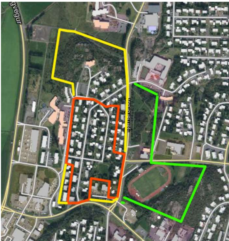
Mynd 6. Mögulegar útfærslur á stækkun verndarsvæðis í byggð á Egilsstöðum umfram fyrsta svæðið sem gerð er tillaga um, afmarkað rauðri línu. Möguleiki A er markaður gulri línu, og útfærsla B með grænni línu.