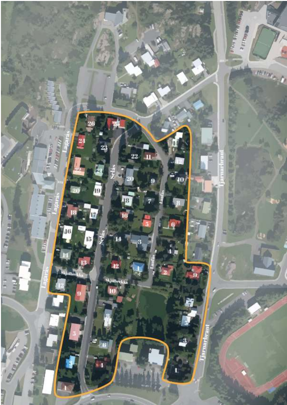
Mynd 1. Loftmynd af elsta íbúðarhúsaþverfinu á Egilsstöðum með húsnúmerum. Gul lína sýnir útmörk fyrirhugaðs verndarsvæðis. (Kort: Steinrún Ótta Stefánsdóttir.)