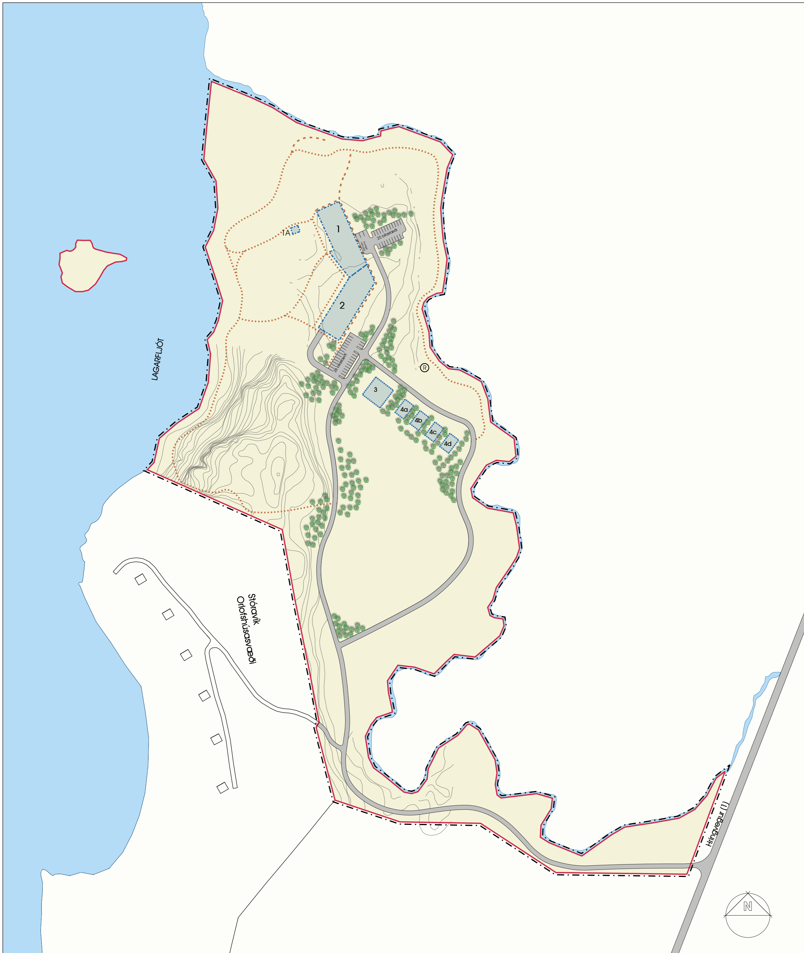
DEILISKIPULAGSUPPDRÁTTUR, Mkv. 1:5000