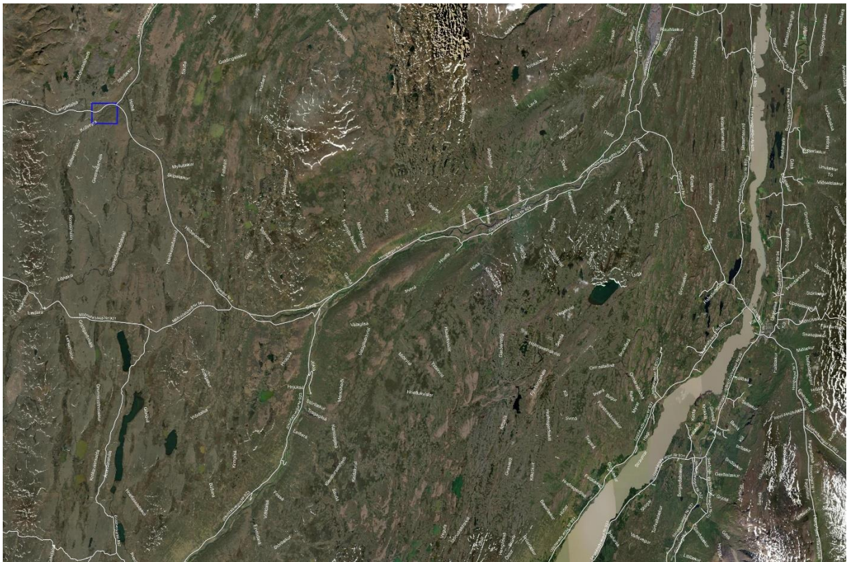
Mynd 1 Skiplagssvæði auðkennt með bláum ramma

Svæðið er á öldóttri hásléttu, ríflega 500 m h.y.s. norðan Jökuldals, móbergshryggir allbrattir og gróður litlir og urðir, en mólendi í undirhlíðum og mýrar og lækir í lægðum.