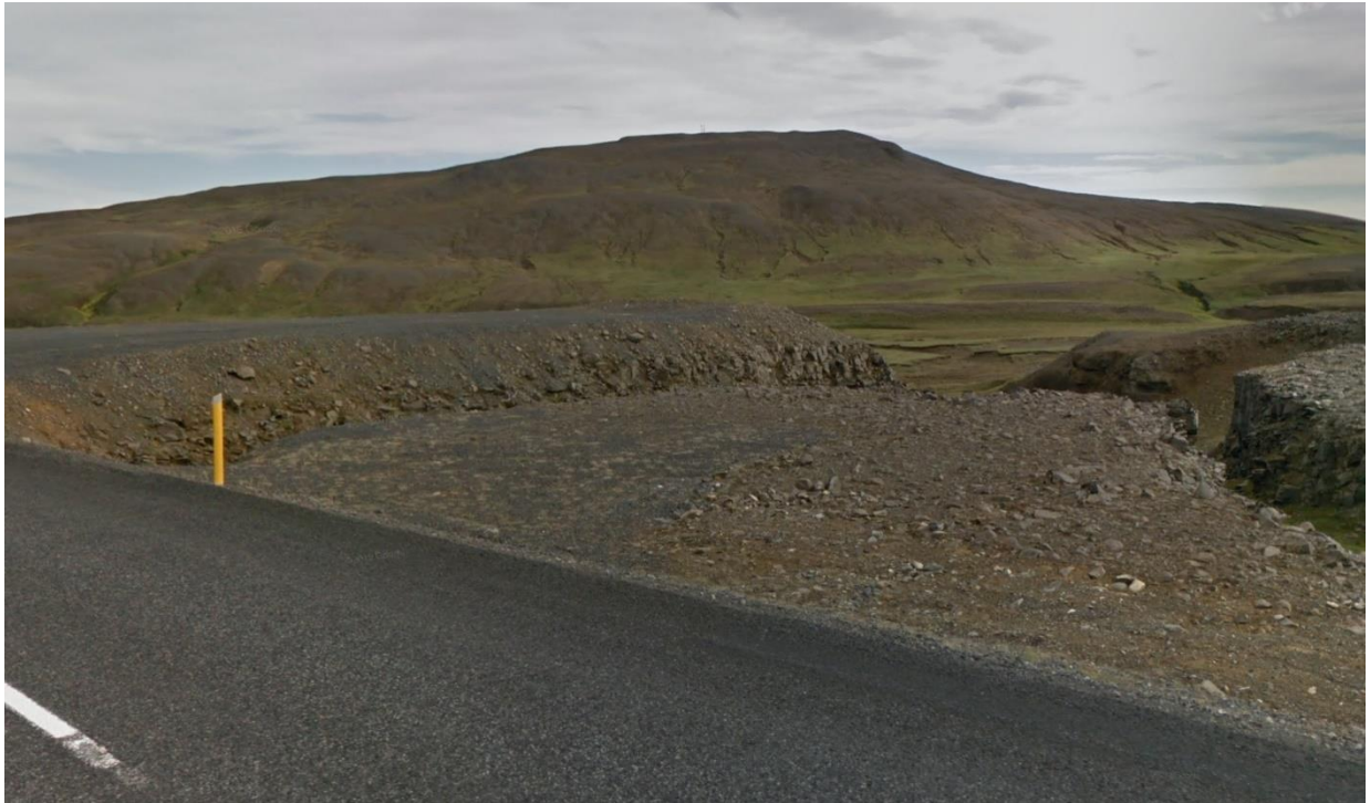
Mynd 3 Gestreiðarstaðaháls, öðru nafni Axlarkollur, og sést í fjarskiptastöð á toppnum

Skipulagssvæðið er við Þjóðveg nr. 1 í austur enda Langadals og upp á Axlarkoll þar sem fjarskiptamastur er staðsett og að áningarplani Vegargerðarinnar við afleggjara til Vopnafjarðar. Svæðið er dæmigert fyrir Jökuldalsheiði, móbergshryggir með grösugum dal á milli þar sem lækir renna um. Langadalsá rennur út úr Langadal um gil sem hefur myndast í móbergshrygg (kubbaberg) og sameinast Kollsá. Fallið frá áætluðu inntaki í stöðvarhús er um 30-40 m.