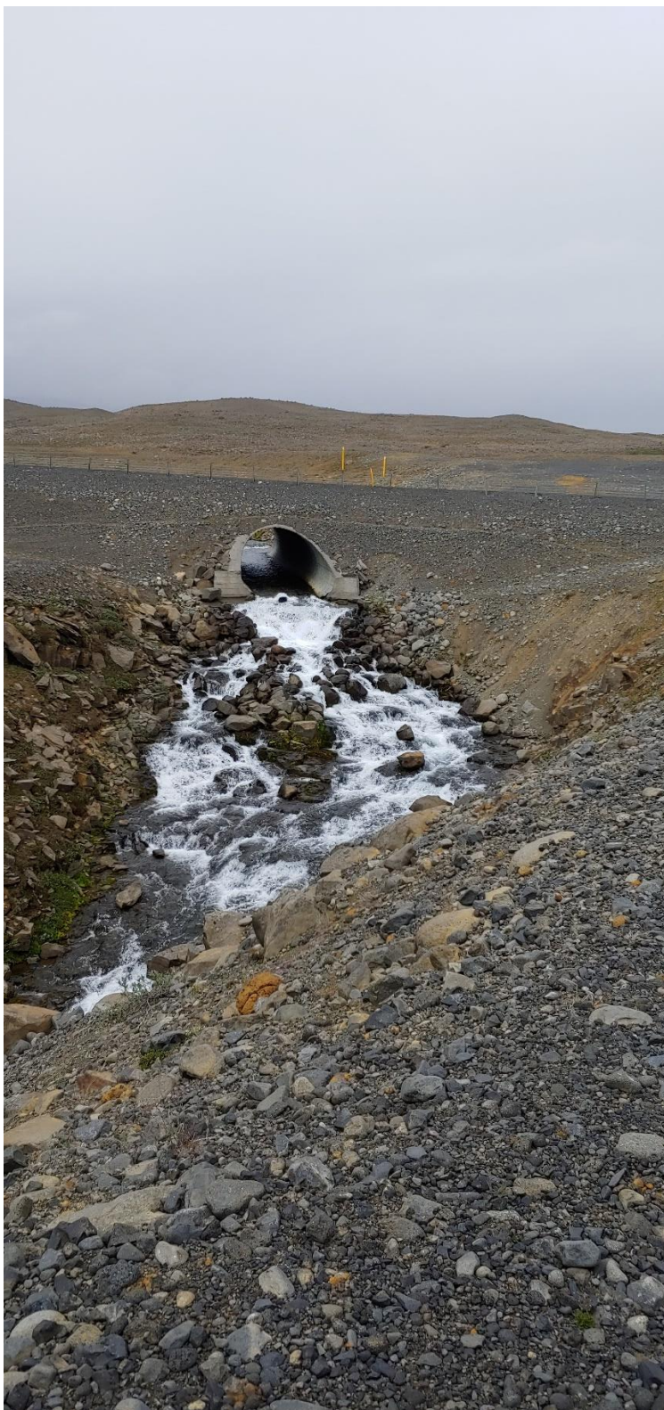
Langadalsá neðan við Þjóðveg 1 að sumri