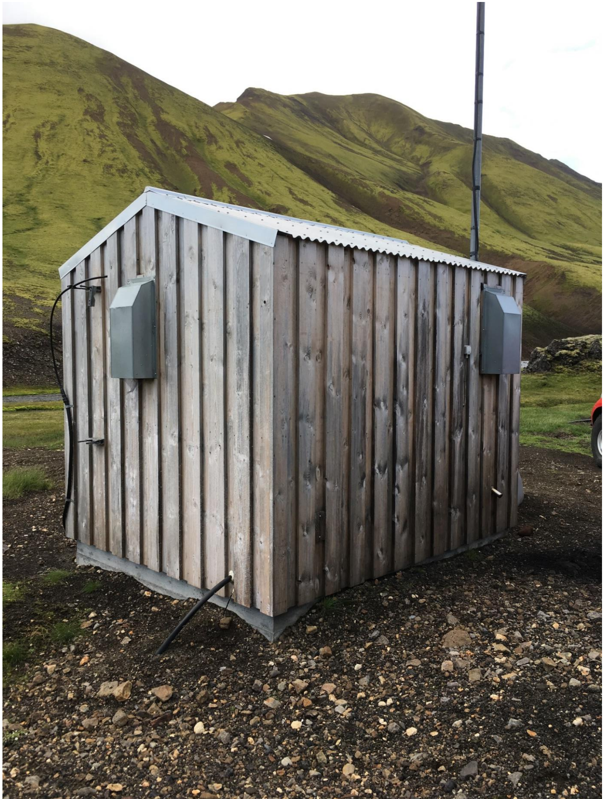
Útlit sambærilegs stöðvarhúss