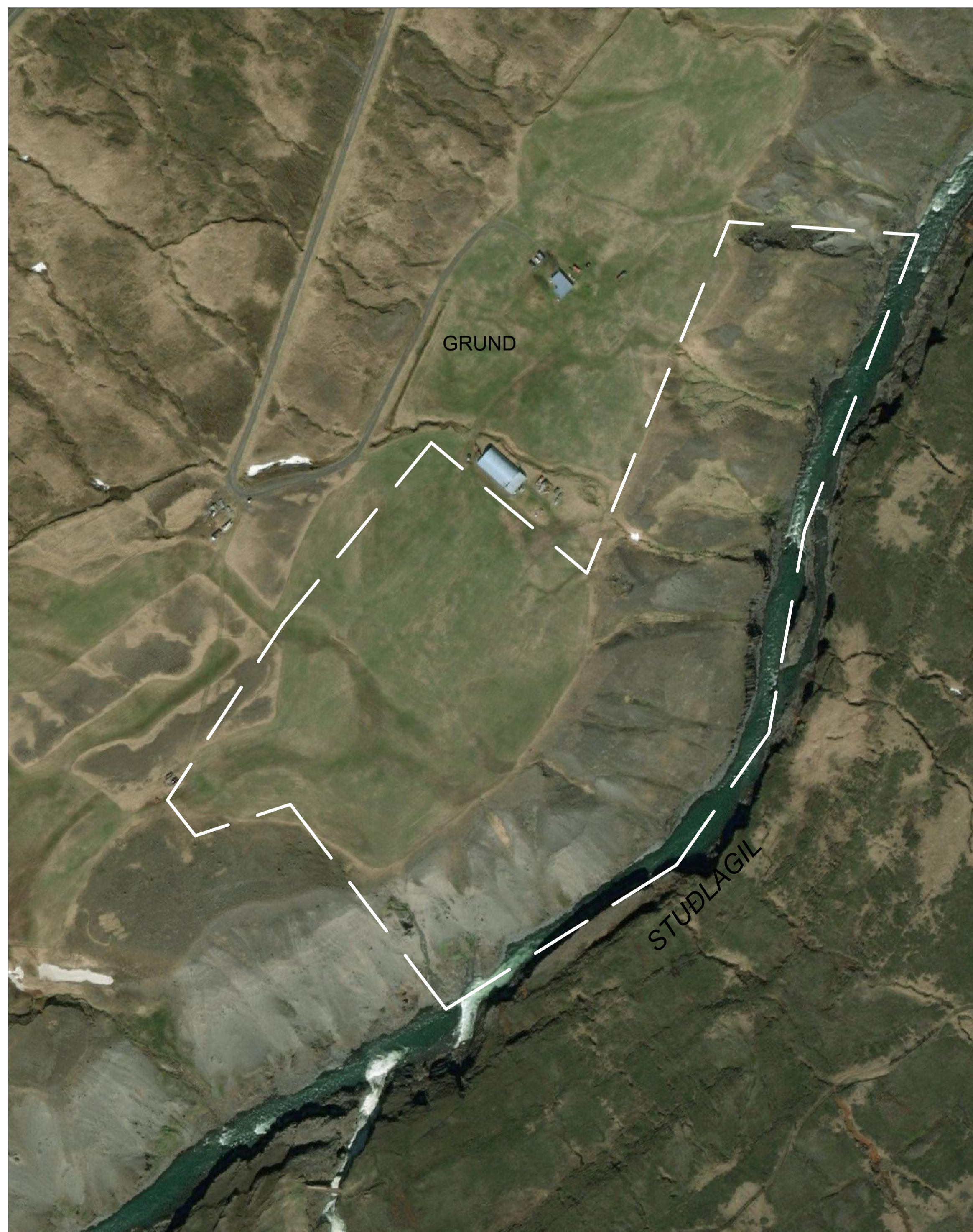
Yfirlitsmynd yfir fyrirhugað skipulagssvæði.