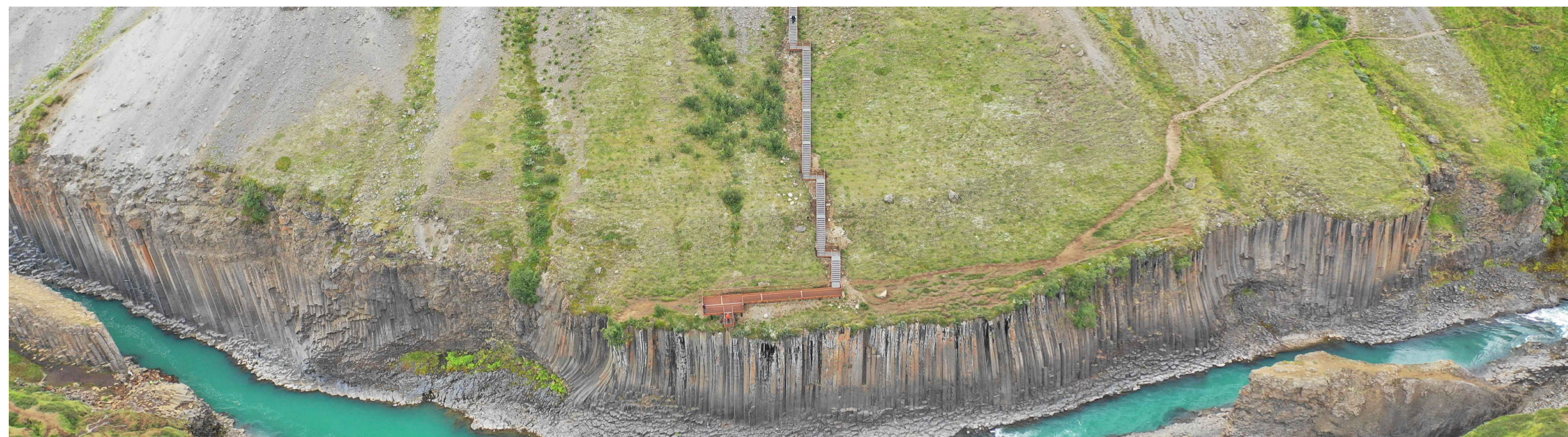
Útsýnissvæði við Stúðlagil