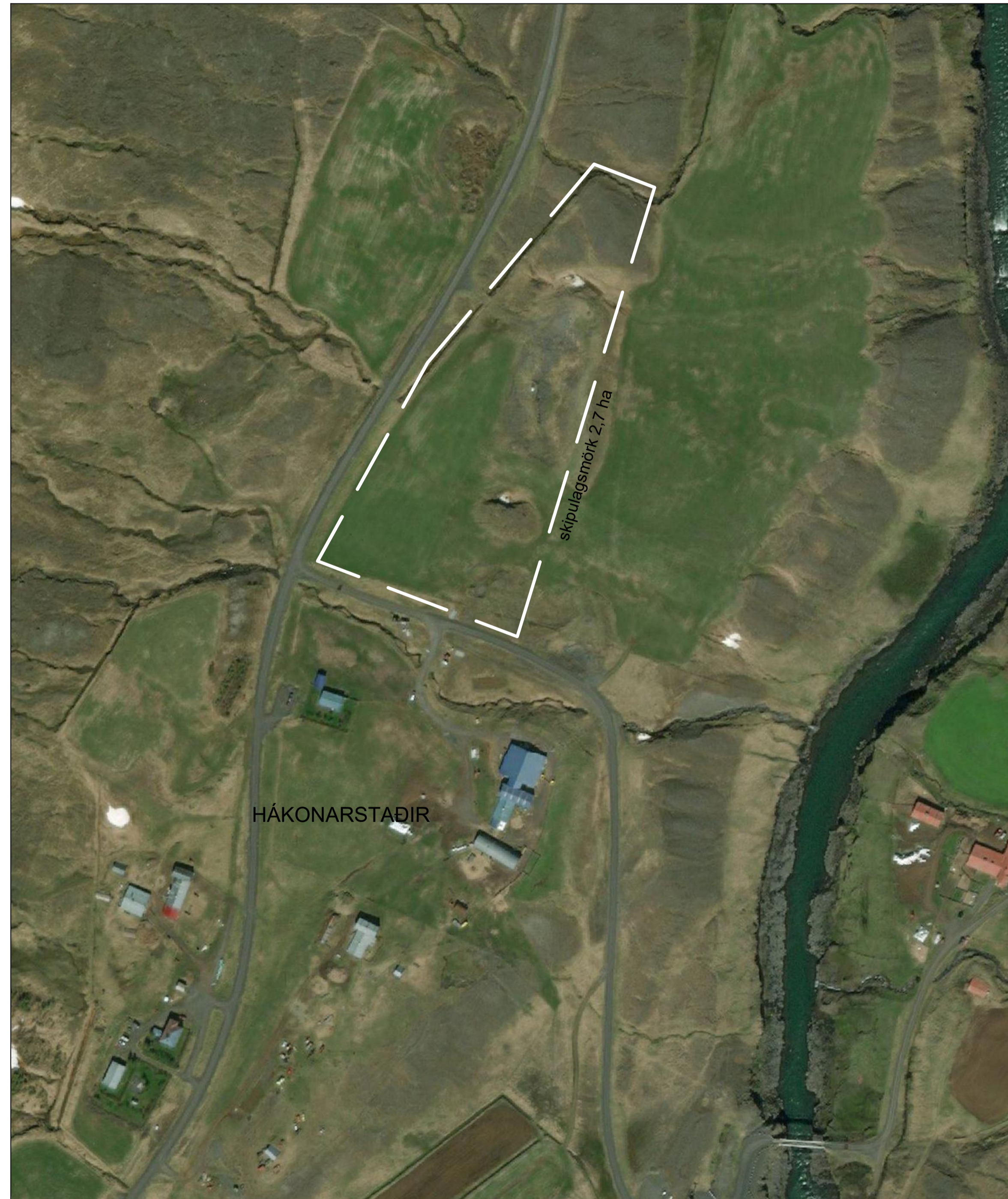
Yfirlitsmynd yfir fyrirhugað skipulagssvæði.