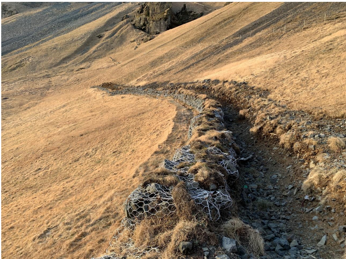
Varnarmannvirki í Herjólfsdal

Lagt er til að reist verði varnavirki til að draga úr úthlaupslengd grjóts innan svæðisins og verja þannig þær byggingar sem þegar hafa verið reistar. Grjóthleðslur í stálvíruðum kössum (e. Gabon) í brekkufæti upp á veginum eða ofan við húsin myndi minnka áhættu einstaklinga á svæðinu til mikilla muna og draga úr raski og óþægindum sem gæti hlotist af grjóthruni. Slík varnavirki hafa reynst vel í gegnum tíðina til að verja vegi eða svæði fyrir grjóthruni, eins og t.d. innanlega í Herjólfsdal og víða meðfram vegum landsins.... „