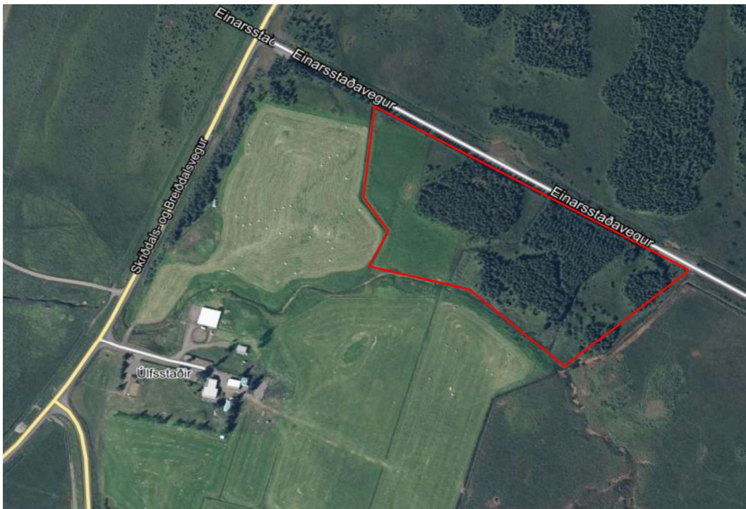
Mynd 2. Staðsetning fyrirhugaðs skipulagssvæðis á loftmynd.

Skipulagssvæðið er um 4,3 ha að stærð og er staðsett sunnan við veginn upp að frístundabyggð að Einarstöðum og Úlfsstaðaskógi. Markmið með deiliskipulaginu er að skipuleggja lóðir fyrir frístundahús sem ætlaðar eru til sölu á opnum markaði. Skipulagið er ætlað að skapa ramma utan um heildstæða frístundabyggð með það að markmið að landnýting á svæðinu verði eins hagkvæm og kostur er.