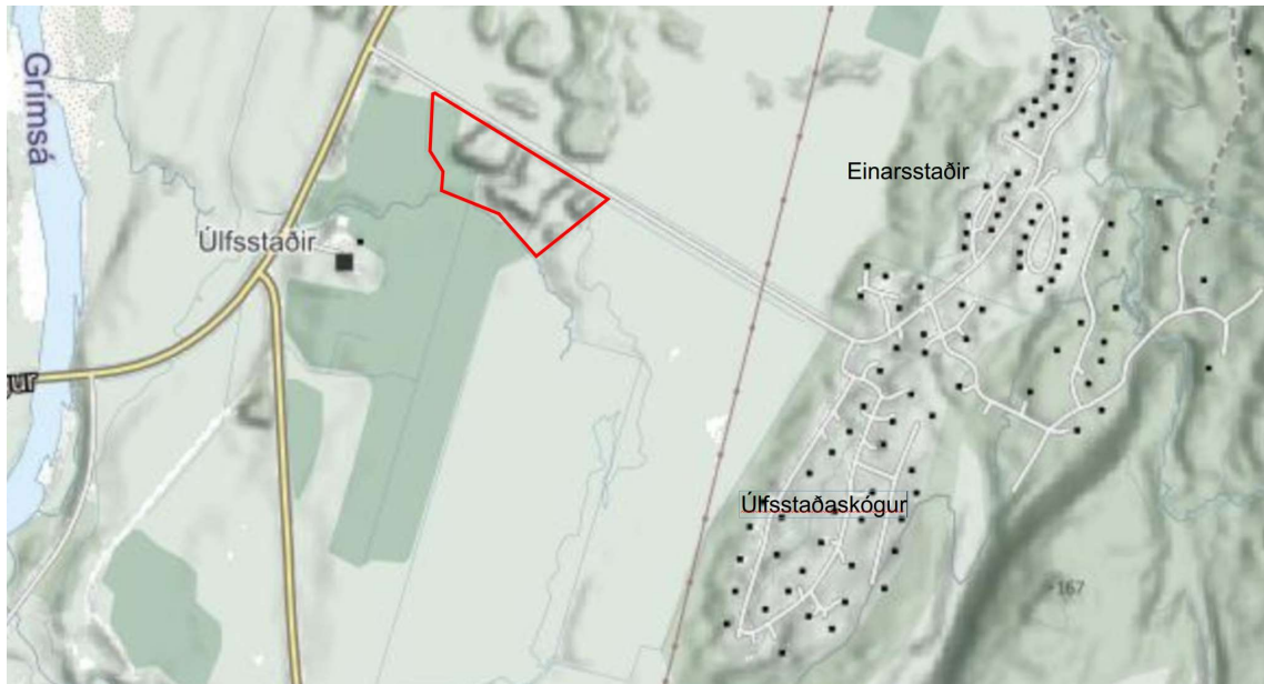
Mynd 1. Staðsetning deiliskipulagssvæðis, merkt með rauðri línu.

Svæðið er skilgreint sem landbúnaðarland í gildandi Aðalskipulagi Fljótsdalshéraðs 2008-2028. Ekki er í gildi deiliskipulag fyrir svæðið og er því um að ræða sameiginlega skipulagslýsingu fyrir aðalskipulagsbreytingu og nýtt deiliskipulag.