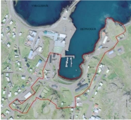
Mynd 2: Afmörkun verndarsvæðis í byggð.

Við voginn í Djúpavogi er afmarkað verndarsvæði í byggð. Þar er gert ráð fyrir samþættri verndun þ.e. að verndun menningarsögulegrar byggðar haldist í hendur við breytingar innan verndarsvæðis og taki mið að því að styrkja varðveislugildi einstakra þátta byggðar (sjá mynd 2). Skilmálum má í grófum dráttum skipta í tvennt. Annars vegar skilmálar sem taka til þess sem nú þegar er á svæðinu, þ.e. hús, mannvirki, umhverfi og almannarými. Hins vegar nýrrar uppbyggingar innan svæðisins 13 .