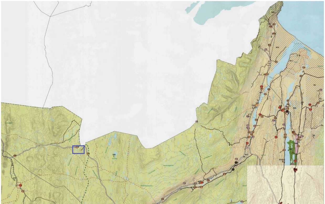
Mynd 4 Umrætt svæði innan fernings (blár) - klippa úr Aðalskipulagi Fljótsdalshéraðs 2008- 2028