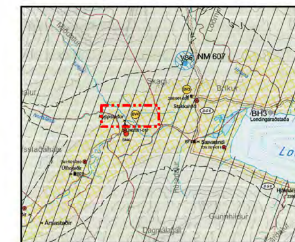
Aðalskipulag Borgarfjarðarhrepps 2004-2016

Deiliskipulag þetta sem fengið hefur meðferð í samræmi við ákvæði 41. gr. skipulagslaga nr. 123/2010 var samþykkt